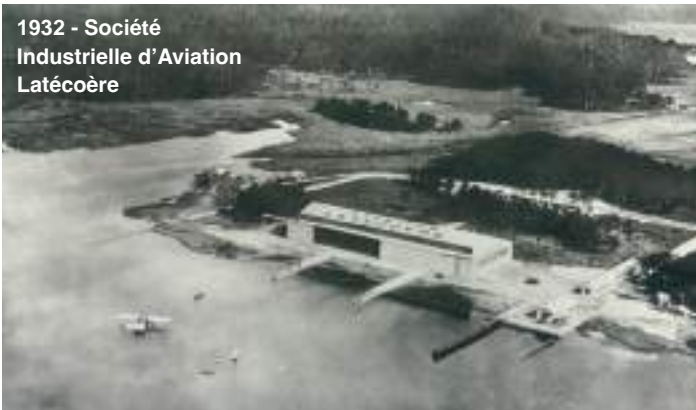
1932 - Société Industrielle d'Aviation Latécoère